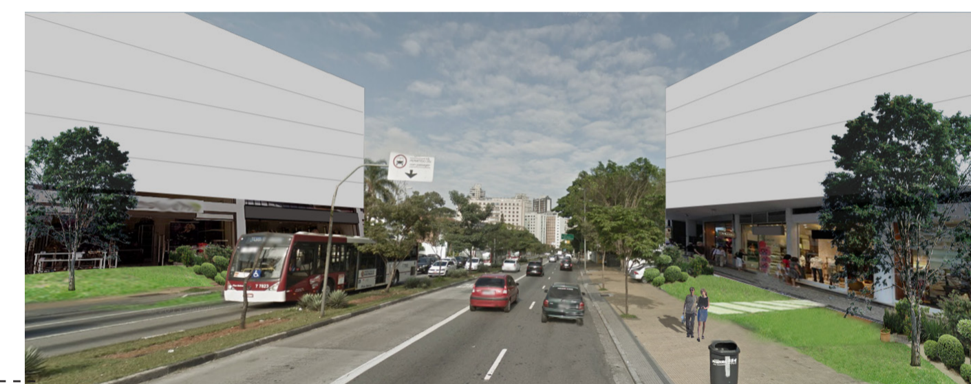
imagem da proposta para Avenida 9 de Julho