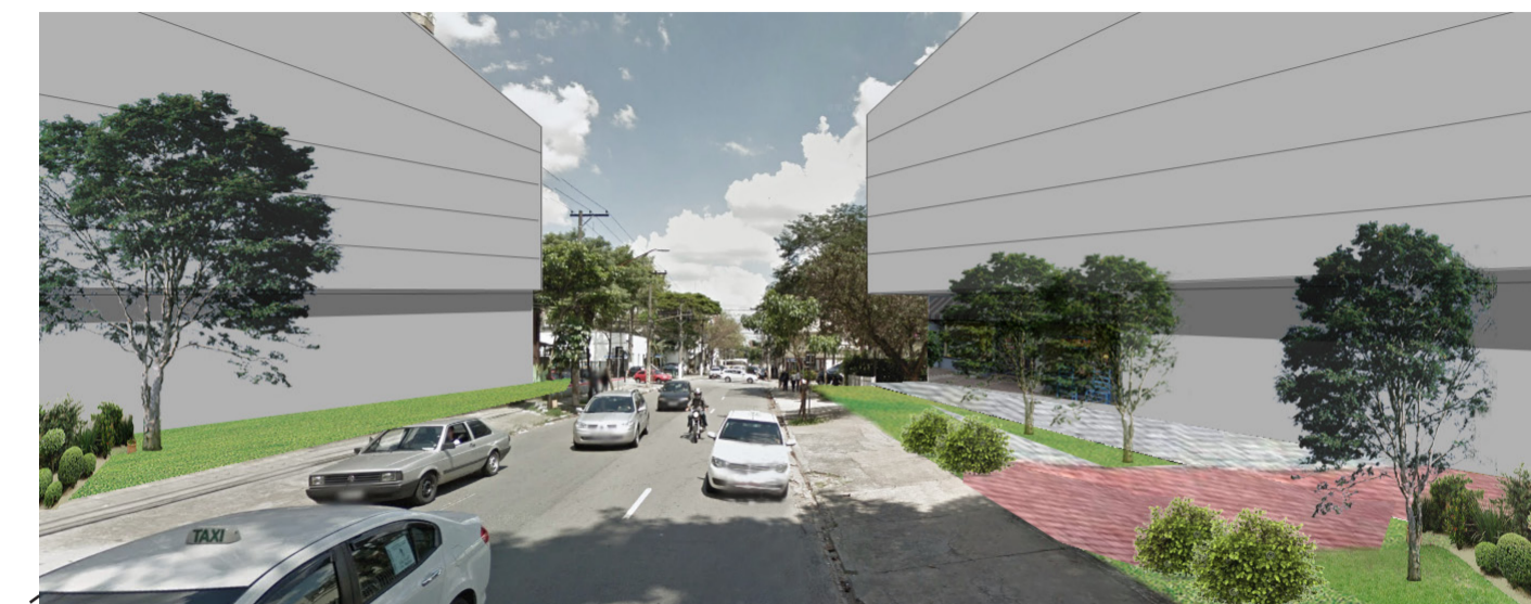
Imagem da proposta para Rua Estados Unidos

Não se trata de desconsiderar as virtudes deste trecho da malha urbana. Ao contrário, a multiplicidade de usos é de extrema conveniência para os usuários desta área. Os critérios adotados nesta proposta podem ser aplicados também para o bairro tombado do Pacaembu e para outras ZER1 da cidade, tais como o Alto de Pinheiros, Alto da Lapa, Butantã. Estes bairros, apesar de não ter a incidência do tombamento tem outra sobreposição de leis. Ainda são regidos pelos critérios da Cia City, que os desenhou. Outra sobreposição de legislação que merece ser revisada