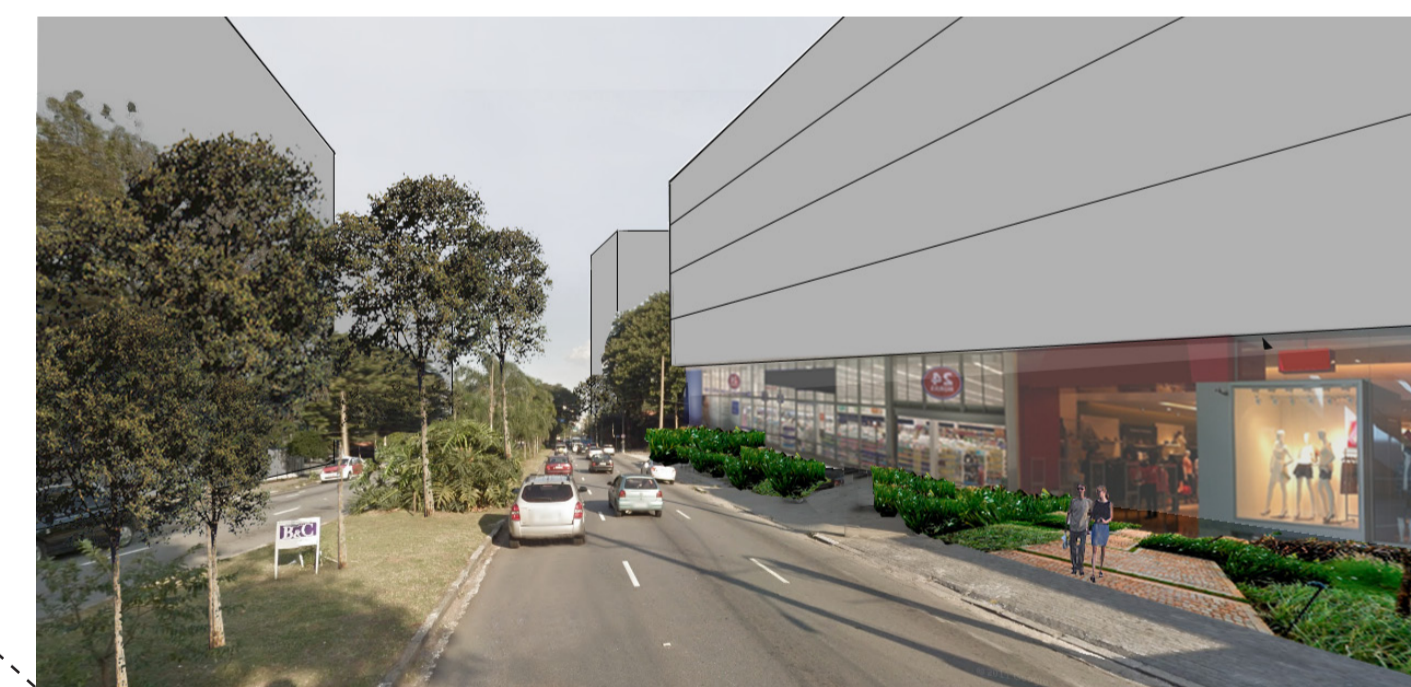
Imagem da proposta para Avenida Brasil