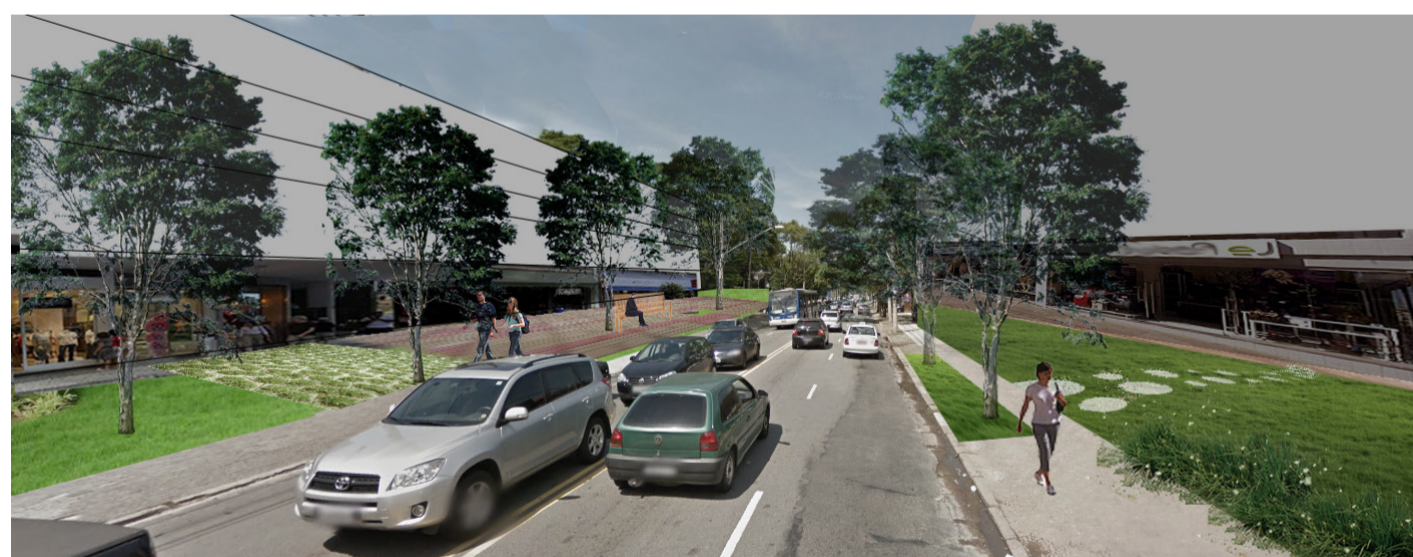
Imagem da Proposta para a Avenida Europa