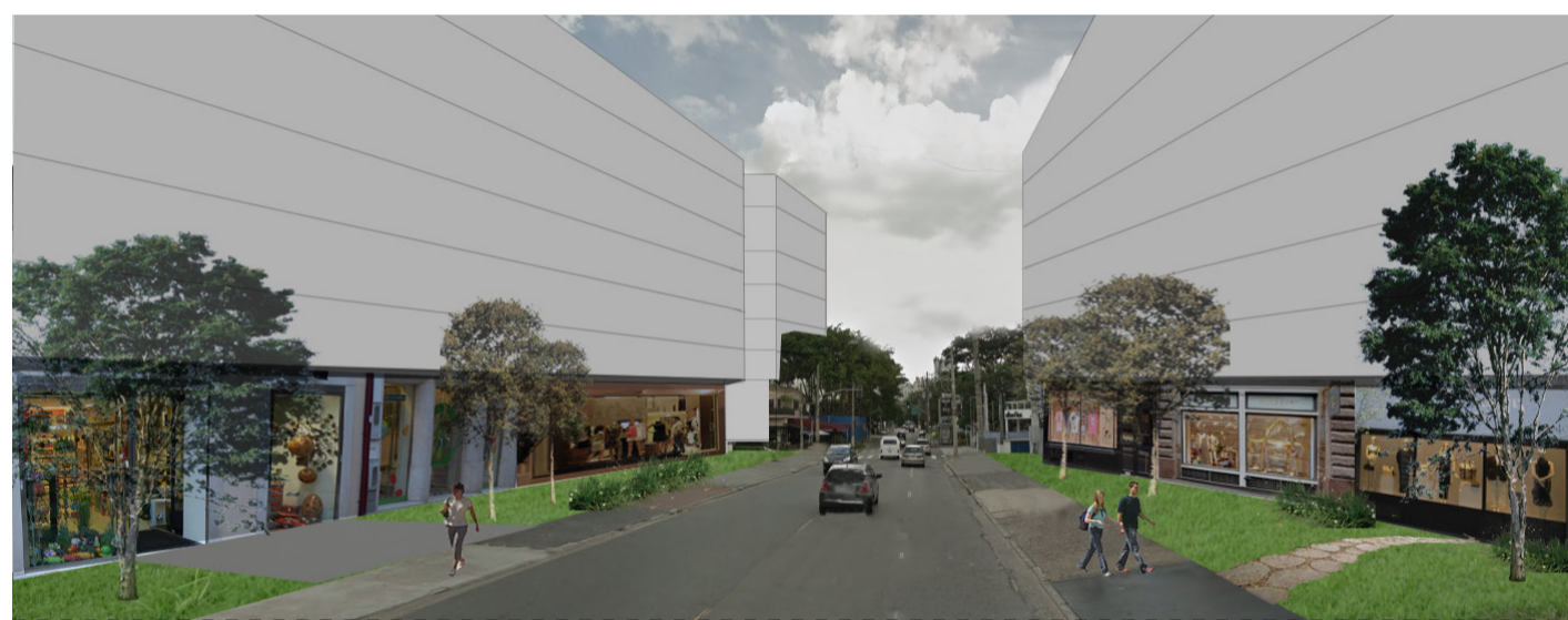
imagem da proposta para Rua Gabriel Monteiro da Silva