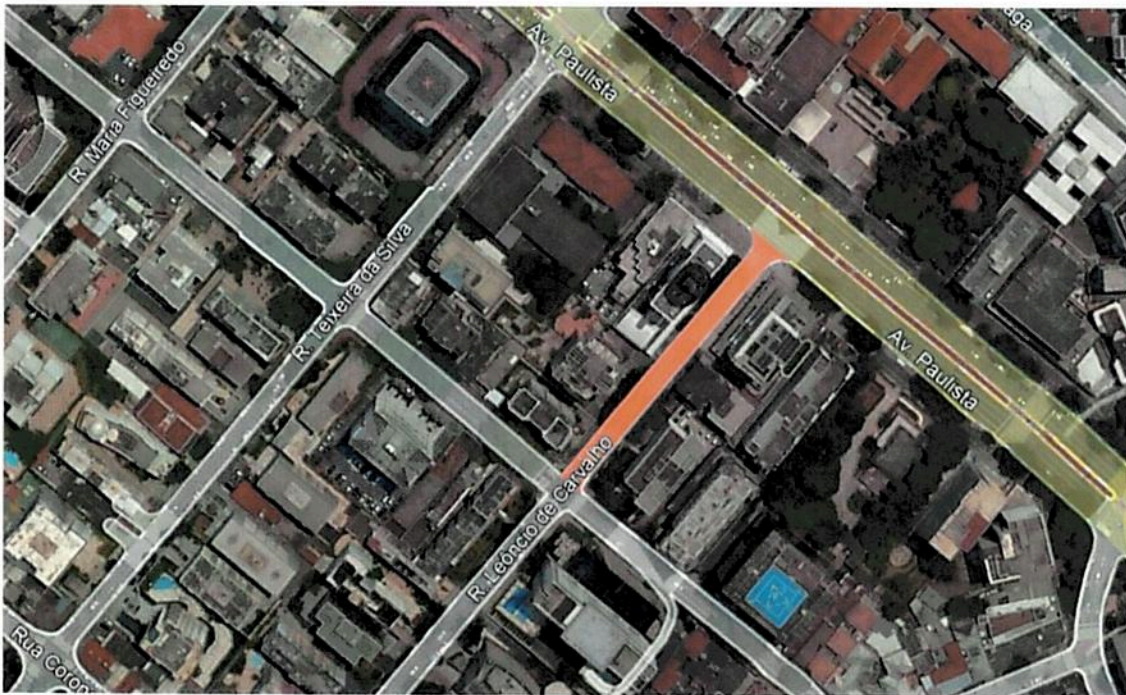
Fig. 02 – Planta do projeto de requalificação urbana da Rua Leôncio de Carvalho (arquivo PAU 05 ARQ EX 01-05 02-F2, disponível no documento 058560677, do processo SEI 6068.2022/0001080-4).

Fig. 01 – Local de projeto de requalificação urbana da Rua Leôncio de Carvalho destacado pela cor laranja.