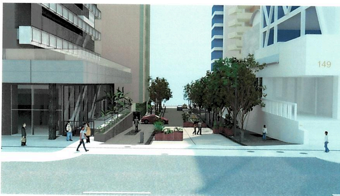
Fig. 03 – Perspectiva do local de projeto de requalificação urbana da Rua Leôncio de Carvalho com vista a partir da Av. Paulista (imagem retirada da apresentação da Audiência Pública de 16/3/2022).

será dedicado à convivência, entretenimento, cultura, lazer e inclusão social próximo à Avenida Paulista. As figuras 3 e 4, a seguir, demonstram perspectivas da área de projeto: