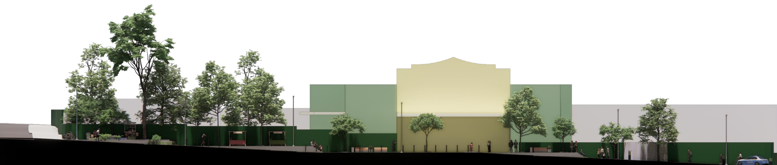
Imagem 02 – Corte AA do Estudo Referencial de Requalificação da Alameda dos Guaiós. Produzido por SMUL/PMSP..