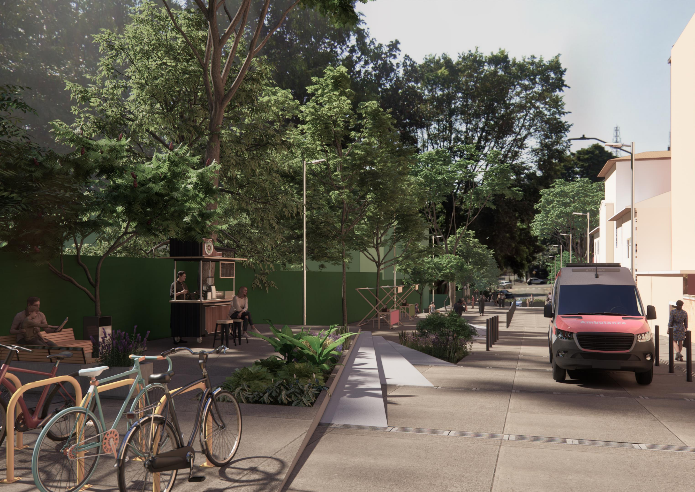
Imagem 06 – Perspectiva do Estudo Referencial de Requalificação da Alameda dos Guaiós – Vista a partir da Av. Itacira. Produzido por SMUL/PMSP.