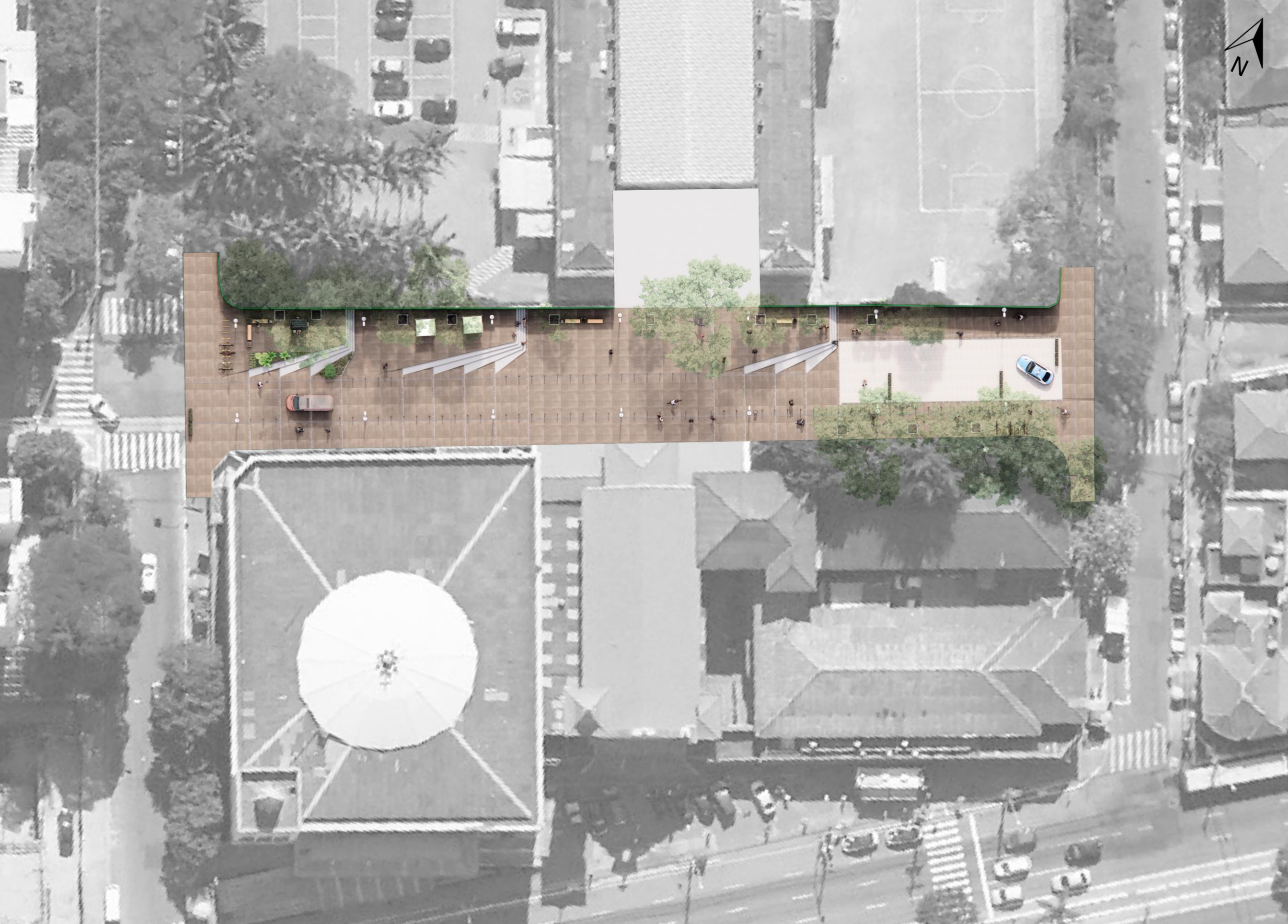
Imagem 01 – Implantação do Estudo Referencial de Requalificação da Alameda dos Guaiós. Produzido por SMUL/PMSP.