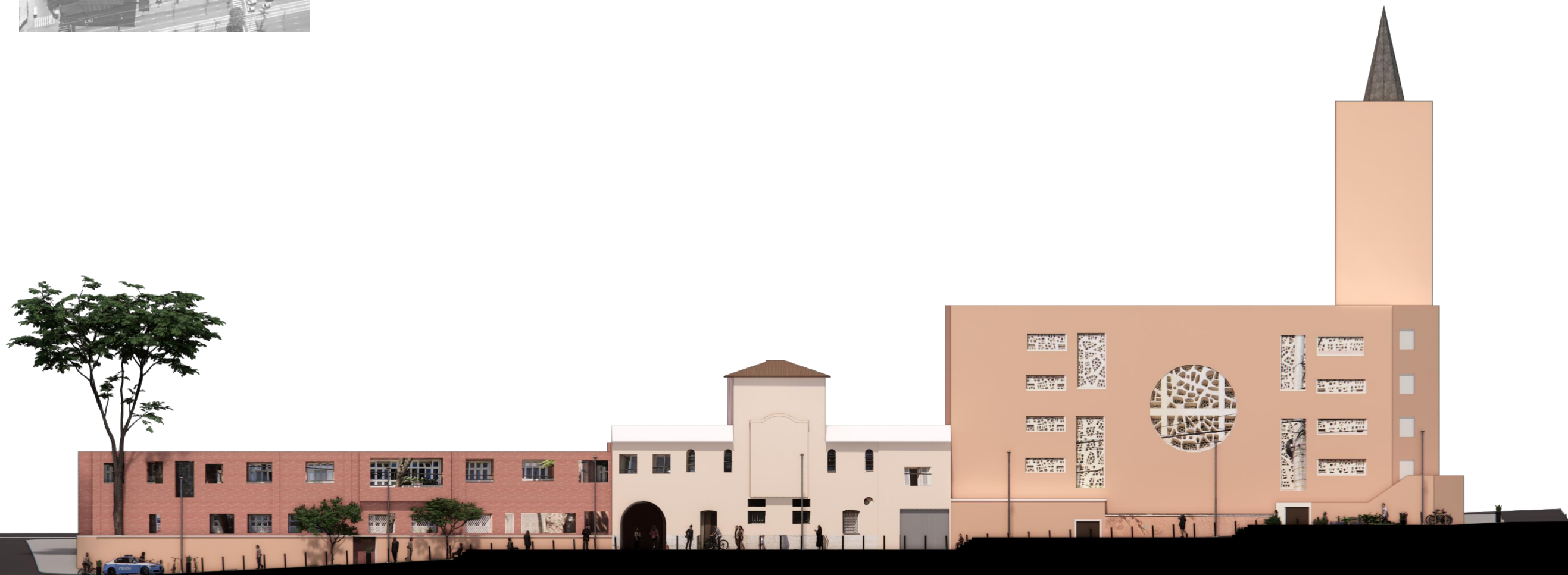
Imagem 03 – Corte BB do Estudo Referencial de Requalificação da Alameda dos Guaiós. Produzido por SMUL/PMSP.