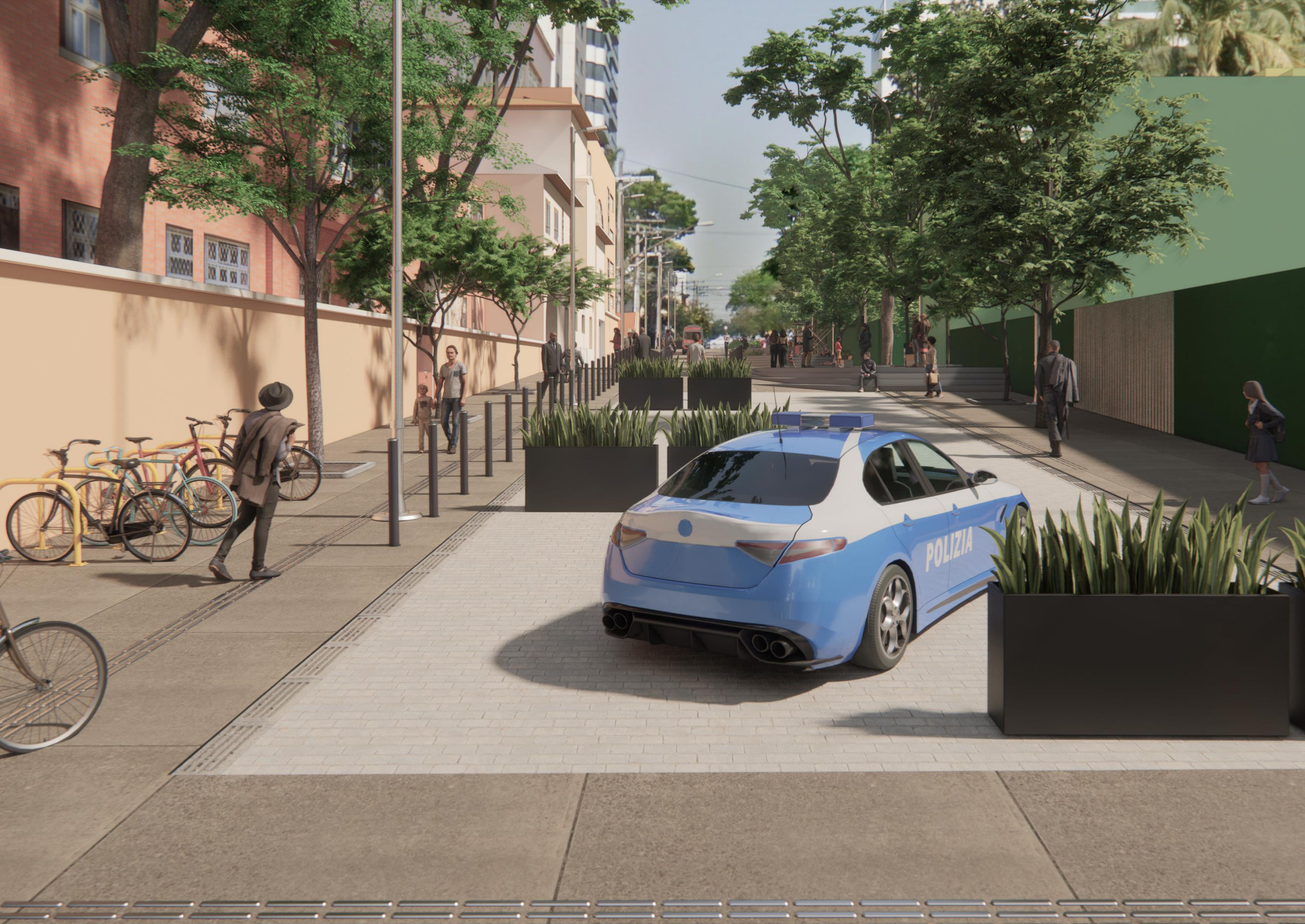
Imagem 05 – Perspectiva do Estudo Referencial de Requalificação da Alameda dos Guaiós - Vista a partir da Av. Piassanguaba. Produzido por SMUL/PMSP.