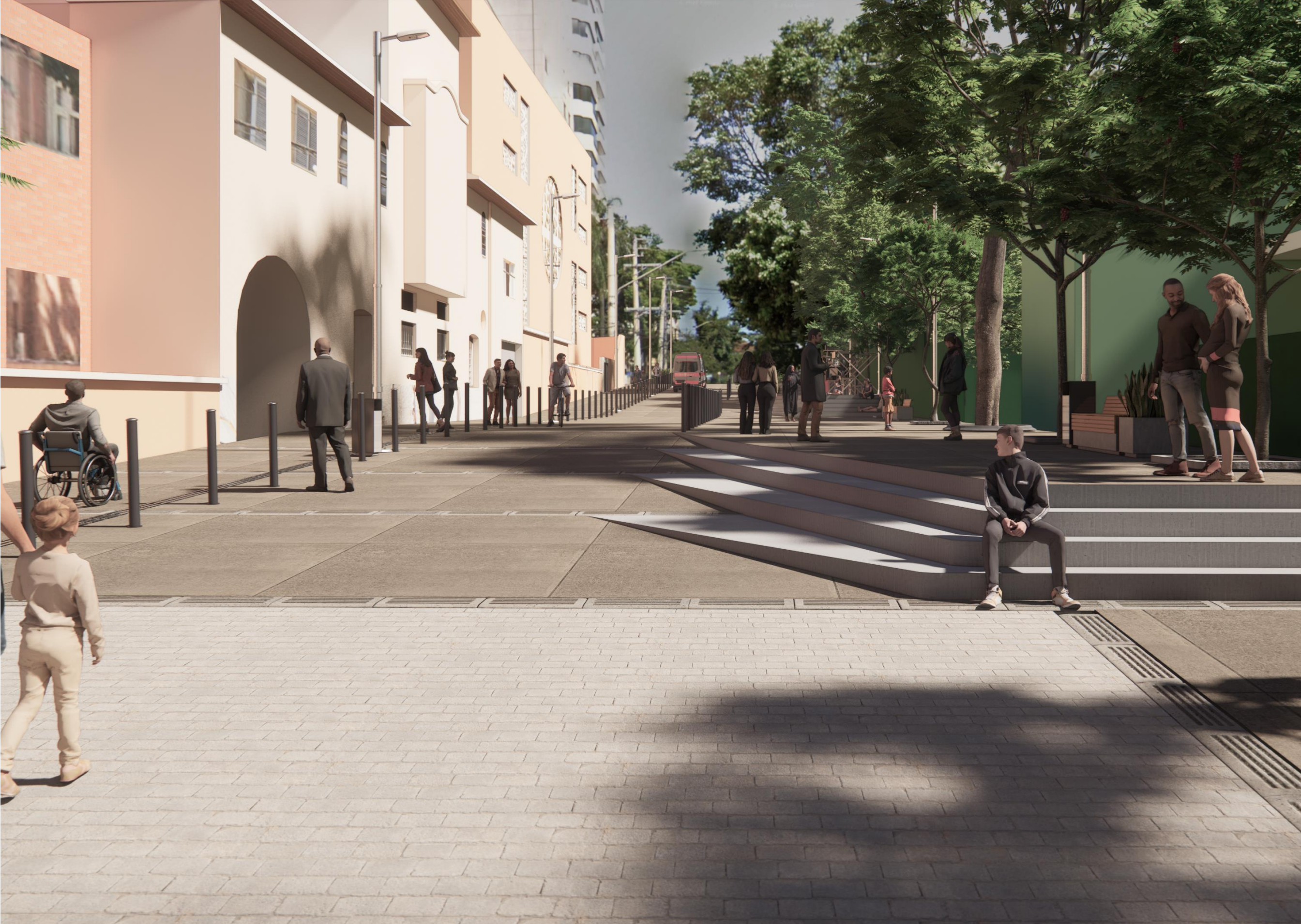
Imagem 04 – Perspectiva do Estudo Referencial de Requalificação da Alameda dos Guaiós – Vista a partir da Av. Piassanguaba. Produzido por SMUL/PMSP.