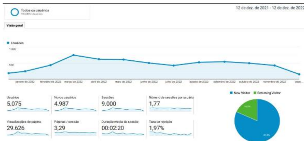
Figura 3 - Acessos na Plataforma de Monitoramento do PDE (12/2021 a 12/2022)

revisão se estendeu para 2022, ano em que os acessos à plataforma continuaram elevados, mas as análises já tinham sido feitas no ano anterior.