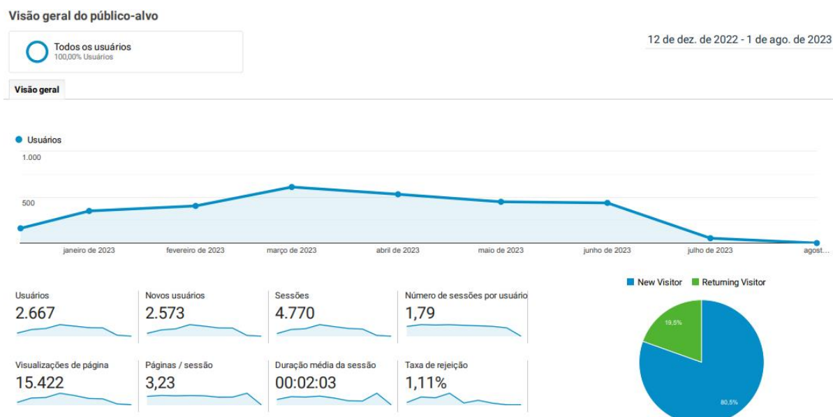
Figura 1 - Acessos mensais na Plataforma de Monitoramento do PDE (12/2022 a 08/2023)

As imagens a seguir trazem o resumo da audiência medida pelo Google Analytics.