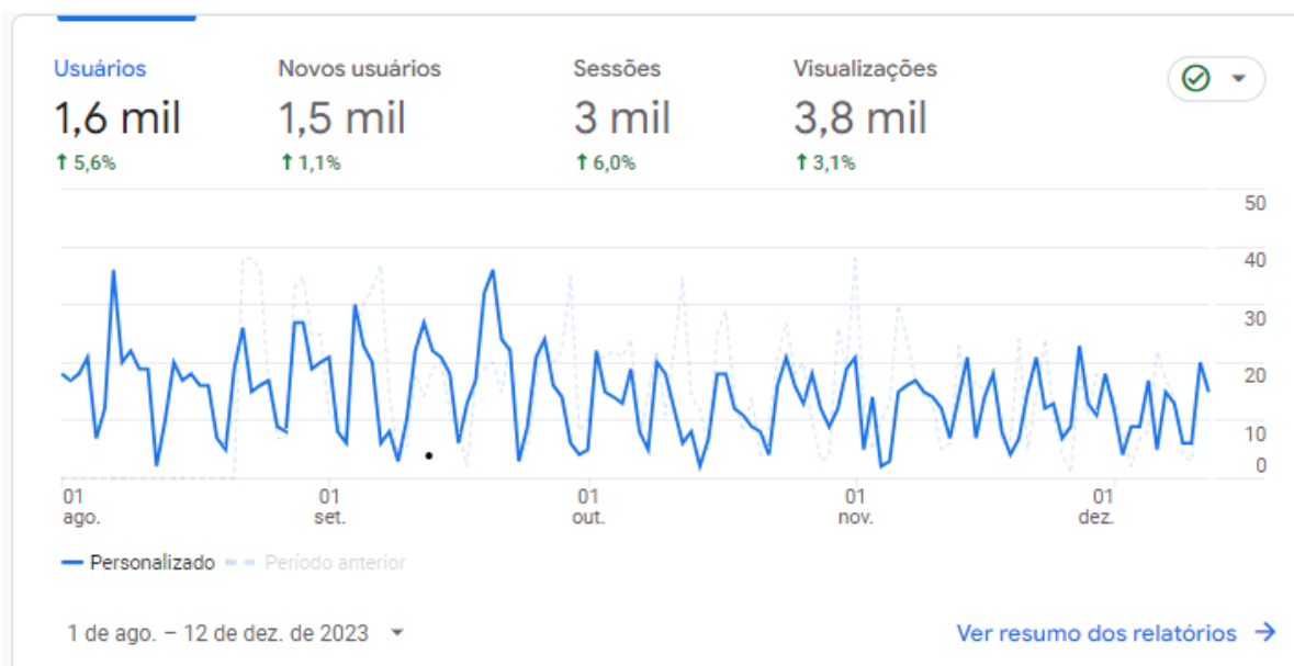
Figura 2 - Acessos diários na Plataforma de Monitoramento do PDE (08/2023 a 12/2023)

A imagem mostra um gráfico de linha horizontal com pico no mês de março de 2023 acompanhando a linha abaixo dos meses de janeiro a agosto de 2023. Apresenta também o quantitativo de usuários: 2667; novos usuários: 2573; sessões: 4770; sessões por usuário: 1,79; visualizações de páginas: 15422; Páginas/sessão: 3,23; duração média de sessão: dois minutos e três segundos; e taxa de rejeição: 1,11%.